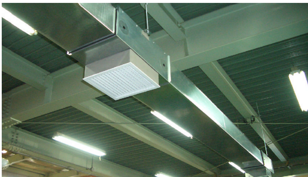
空調用エコダクト「コルエアダクト」