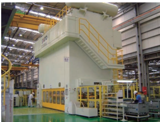
20000kN トランスファープレスライン