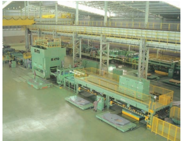
5000kNブランキングプレスライン