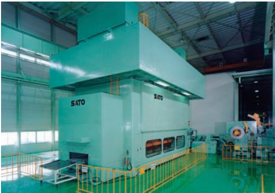
10000kNトランスファープレスライン(リンクモーション)