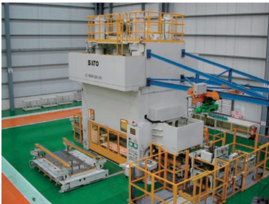
6000kNトランスファープレスライン